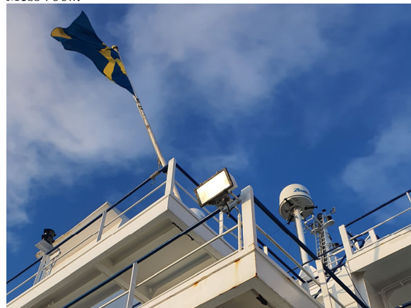
Proudly flying the Swedish flag