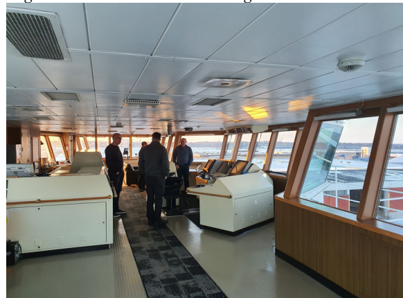
Modern bridge with good visibility