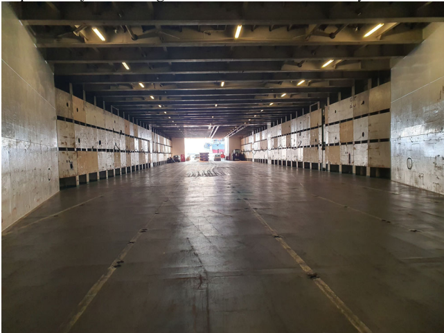
Roro deck looking aft