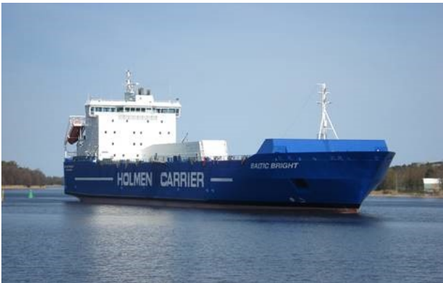
Baltic Bright as new with Holmen logo