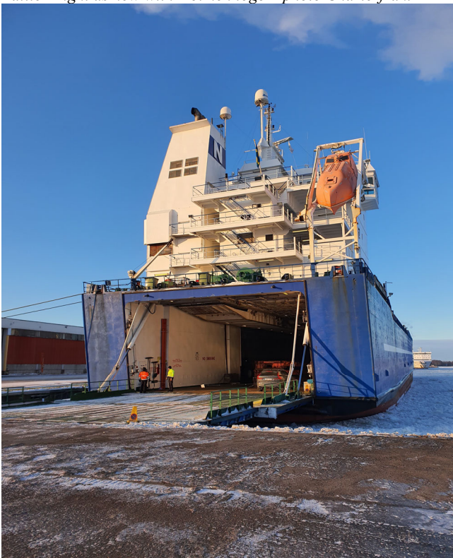
Inspection of Baltic Bright in Kotka 14th-15th January 2021