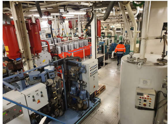
Engine room with 2 x MaK main engines