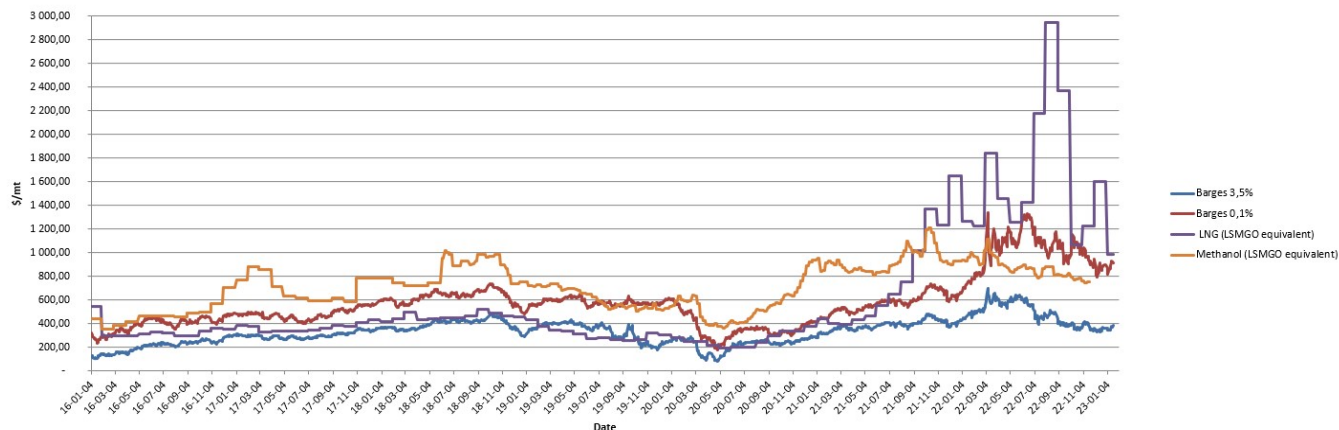
Bunker Prices Rotterdam 2016-